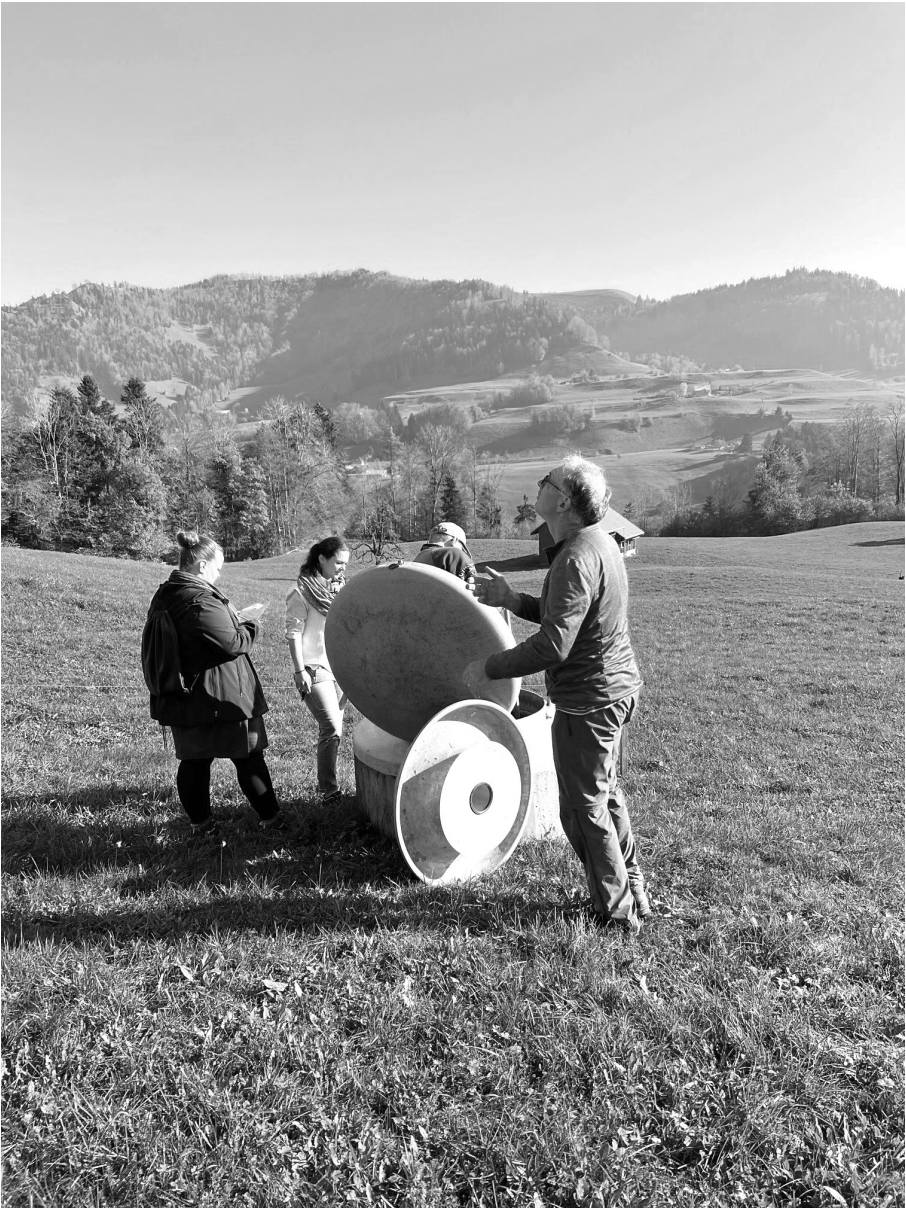
Messung Wassermenge pro Minute (Schwandeln)