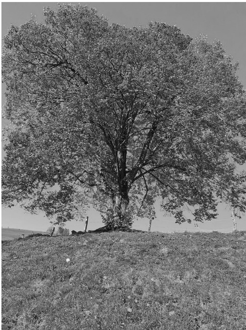
Schattenspender beim Reservoir