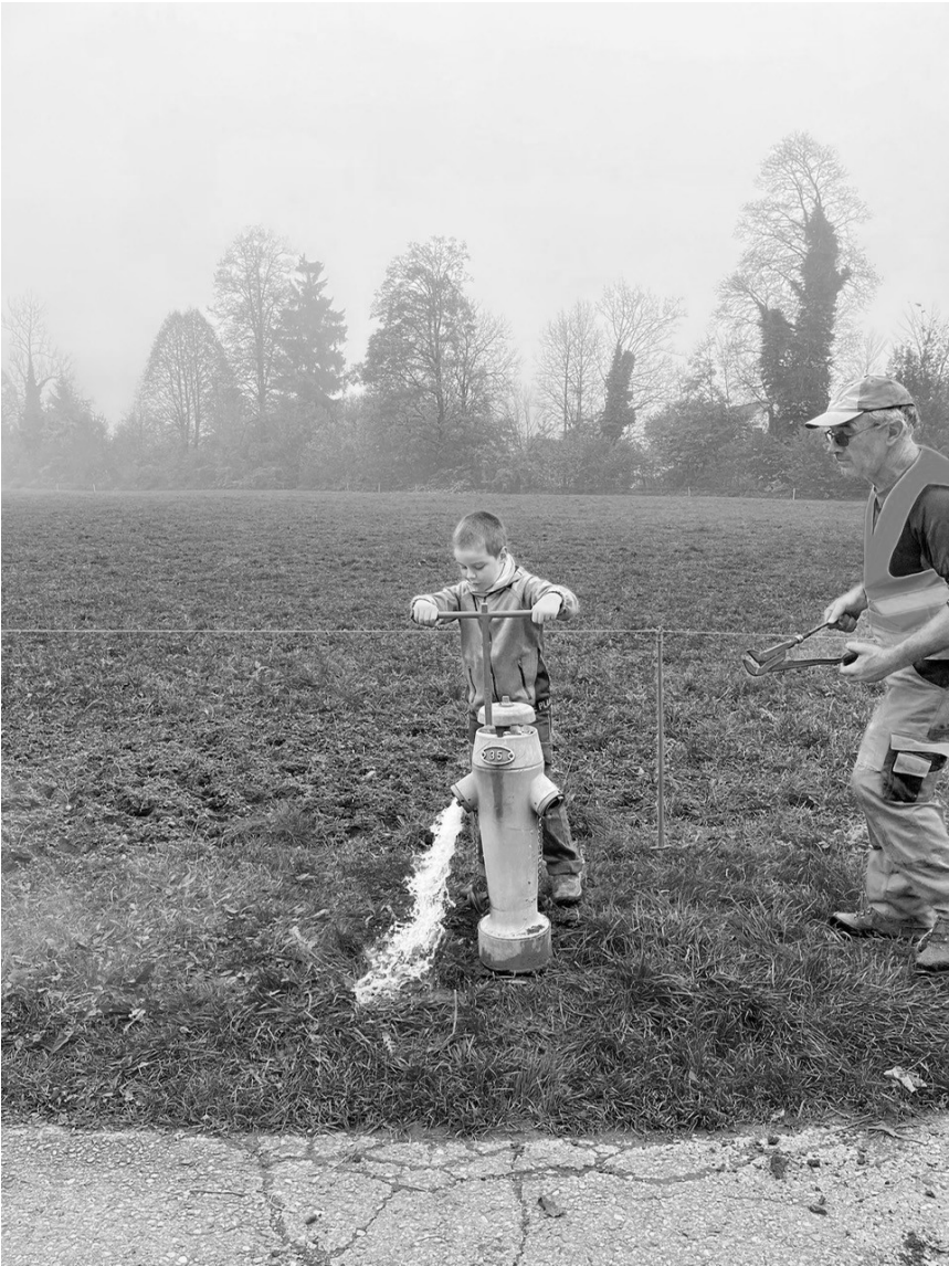
Es wird bereits der Nachwuchs geschult.