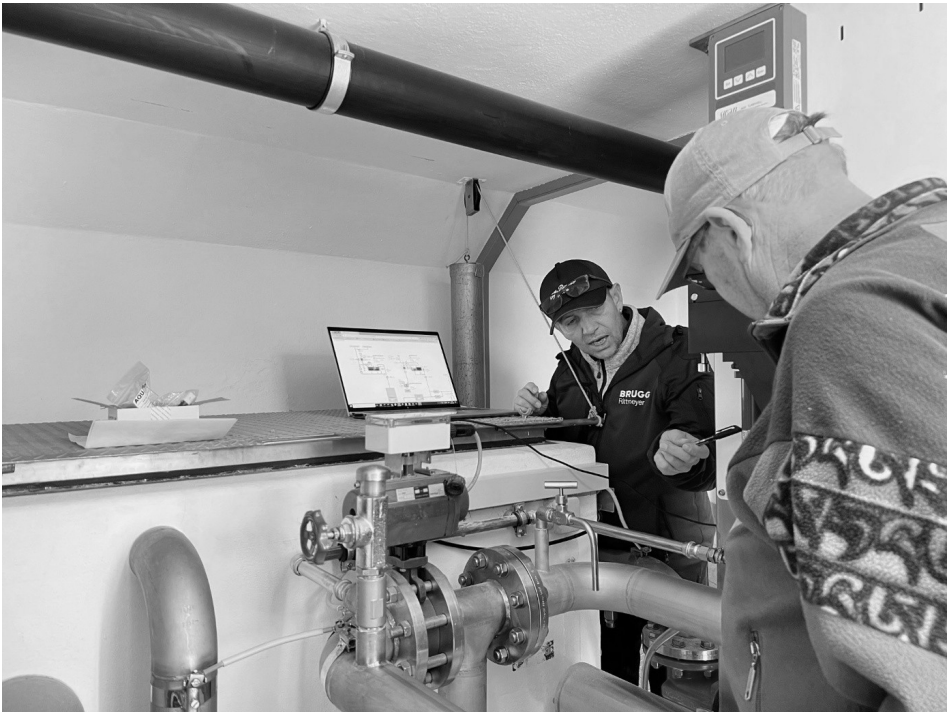
Anlässlich des jährlichen Anlagerundganges im November lässt sich der Vorstand über den aktuellen Stand der Arbeiten zur Inbetriebnahme der neuen UV-Filteranlage und Trübungsmessung informieren.